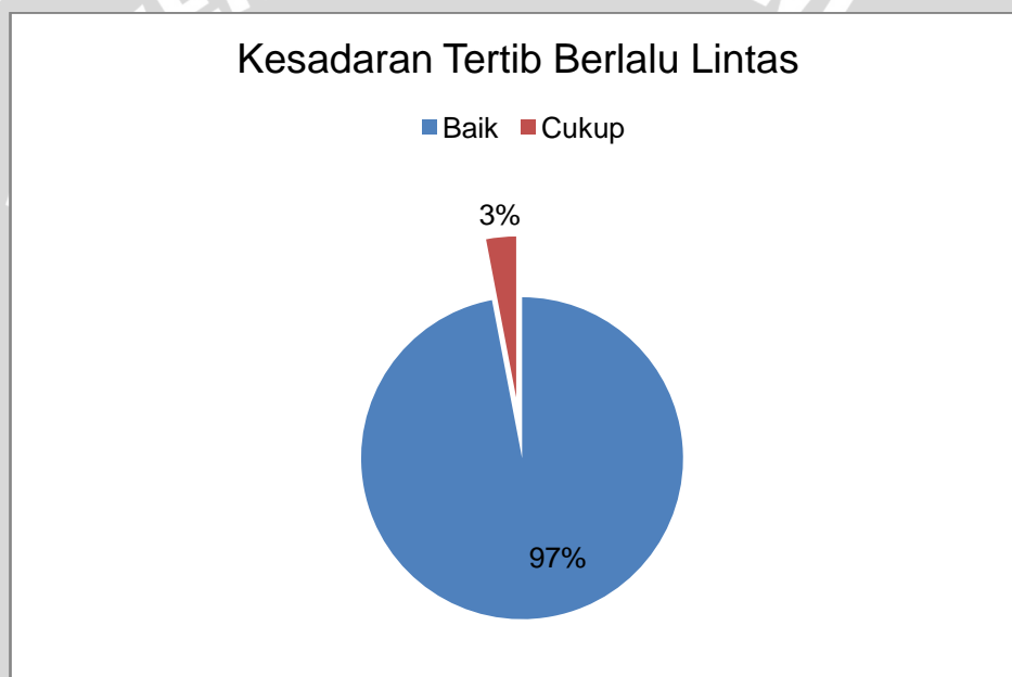
Diagram 5.3 Hasil Kuesioner Kesadaran Tertib Berlalu Lintas SMA Negeri 1 Ngunut

Hasil kuesioner kesadaran tertib berlalu lintas pada siswa SMA Negeri 1 Ngunut didapatkan data sebagai berikut : Siswa yang mempunyai skor baik kesadaran tertib berlalu lintas sebanyak (97%) 129 orang, dan siswa yang mempunyai skor cukup kesadaran tertib berlalu lintas sebanyak (3%) 4 orang. Data selengkapnya bisa di lihat pada diagram 5.3.