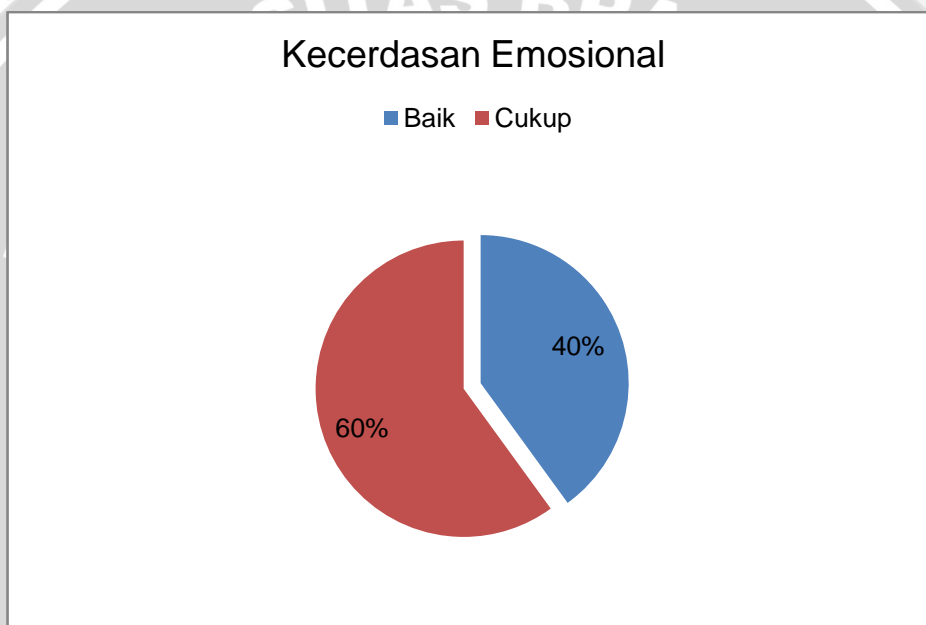
Diagram 5.2 Hasil Kuesioner Kecerdasan Emosional Siswa SMA Negeri 1 Ngunut

Hasil kuesioner kecerdasan emosional pada siswa SMA Negeri 1 Ngunut di dapatkan, siswa yang mendapatkan skor baik sebanyak (40%) 54 orang, siswa yang mendapatkan skor cukup sebanyak (60%) 79 orang. Data selengkapnya dapat di lihat pada diagram 5.2.