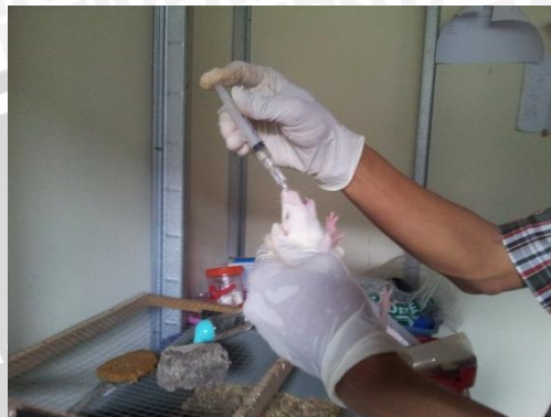
Pemberian endosulfan pada tikus secara oral