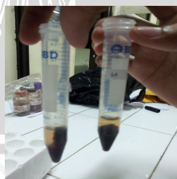
Peletakan darah pada tabung ependorf