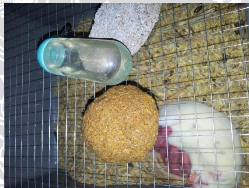
Tikus penelitian di Lab. Fisiologi FKUB