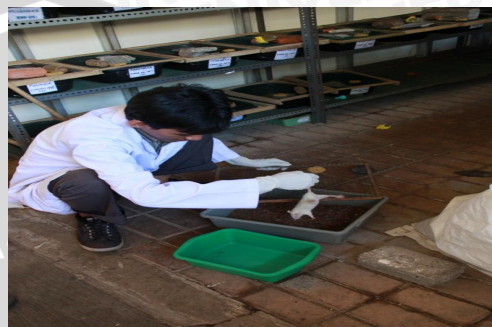
Penggantian sekam dan pemberian makan tikus di lab. Fisiologi FKUB