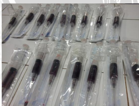
Darah tikus yang telah diambil