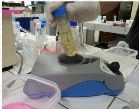
Proses pencampuran endosulfan dan minyak zaitun