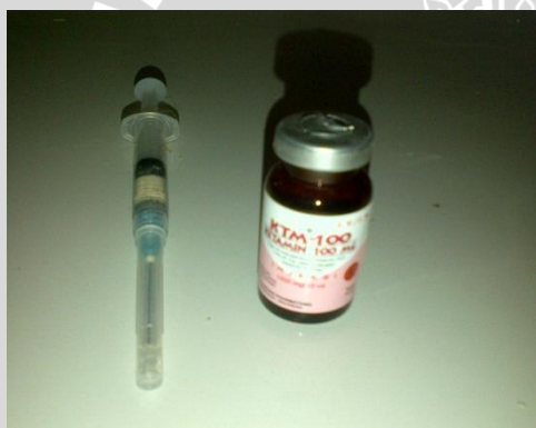
Euthanasia pada tikus yang akan dibedah menggunakan ketamin