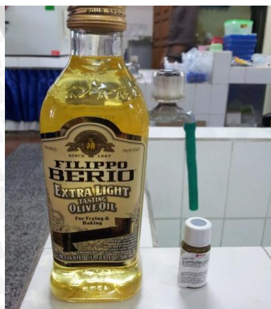
Minyak zaitun dan Endosulfan