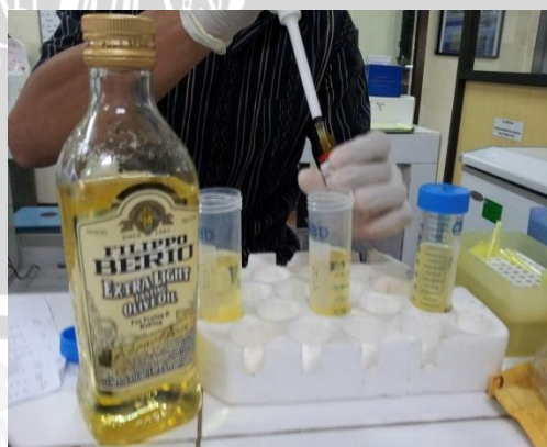
Pembuatan sonde endosulfan