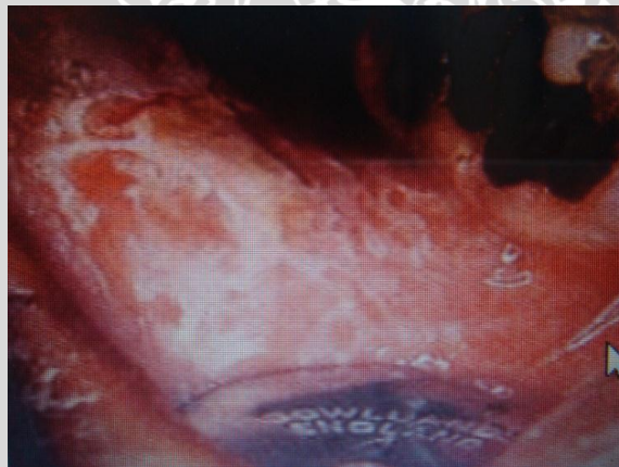
Gambar 2.5 . Lesi mukosa pengguna pinang (Susilo, 2010)

Lesi ini secara umum terlihat pada pengunyahan pinang dan terlokalisir tergantung pada tempat biasanya ramuan sirih diletakkan dan memiliki satu atau lebih karakteristik sebagai berikut : 1.) perubahan warna mukosa rongga mulut, 2.) adanya permukaan yang kasar/keriput, 3.) penebalan mukosa rongga mulut, 4.) permukaan epitel yang scrapable atau non-scrapable. Lesi ini biasanya terdapat di mukosa bukal baik unilateral ataupun bilateral. Biasanya menunjukkan lesi putih berwarna putih keabuan yang tidak dapat dibersihkan. Secara klinis permukaan mukosa kasar dan adanya tekstur seperti Linen dan secara patologis terlihat epitel mengalami parakeratinisasi (Susilo,2010)