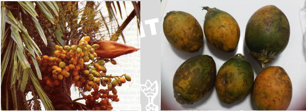
Gambar 2.2. Buah pinang ( Areca catechu Linn)

tumbuhnya lambat dipakai hiasan interior dalam ruangan, lalu dipindahkan ke alam terbuka setelah tanaman tumbuh tinggi. Pinang tidak membutuhkan banyak air. Pinang biasa ditanam di pekarangan, taman atau dibudidayakan. Tanaman ini kadang tumbuh liar di tepi sungai dan di tempat lain (Dalimartha, 2008)