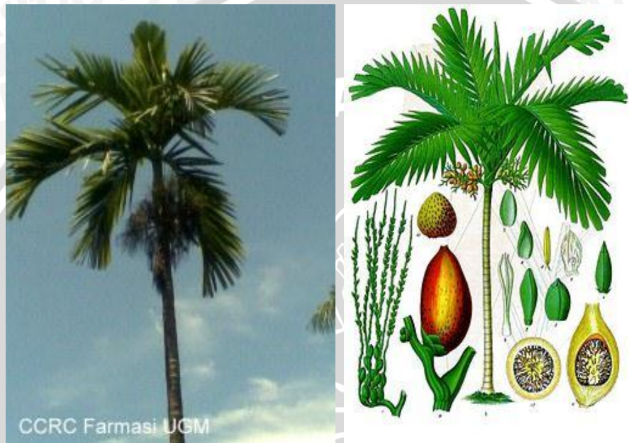
Gambar 2.3 Tanaman Pinang ( Areca catechu Linn) (Handayani, 2012)

Pinang ( Areca catechu Linn) merupakan tanaman famili Arecaceae yang dapat mencapai tinggi 15-20 m dengan batang tegak lurus bergaris tengah 15 cm. Buahnya berkecambah setelah 1,5 bulan dan 4 bulan kemudian mempunyai jambul daun-daun kecil yang belum terbuka. Pembentukan batang baru terjadi setelah 2 tahun dan berbuah pada umur 5-8 tahun tergantung keadaan tanah. Tanaman ini berbunga pada awal dan akhir musim hujan dan memiliki masa hidup 25-30 tahun (Dalimartha, 2008). Biji buah berwarna kecoklatan sampai coklat kemerahan, agak berlekuk-lekuk dengan warna yang lebih muda. Pada bidang irisan biji tampak perisperm berwarna coklat tua