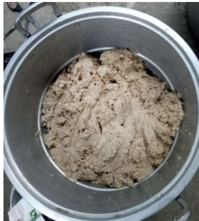
Gambar 4. Adonan jamur tiram yang sudah dicampur dengan bumbu