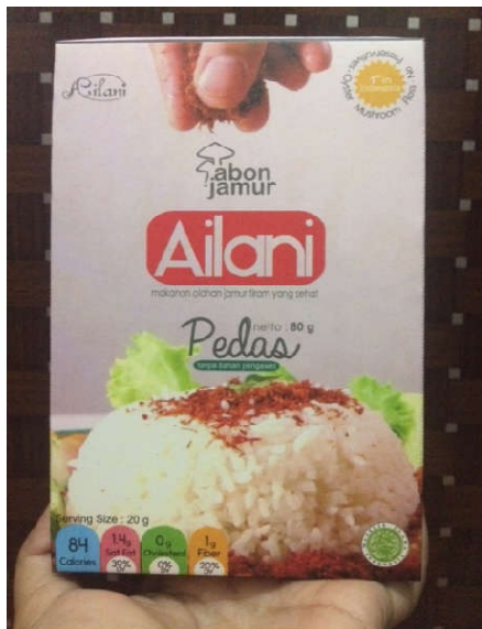
Gambar 7. (a) Abon jamur pedas