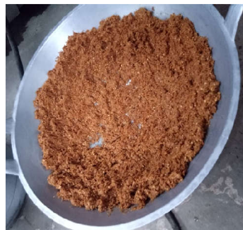
(b) Pendinginan setelah digoreng