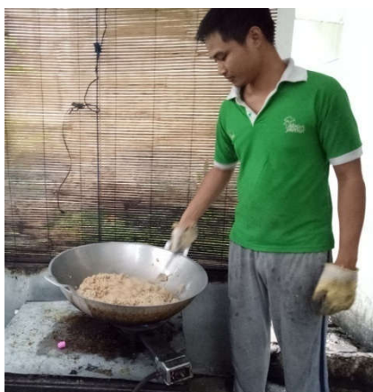
Gambar 5. (a) Proses penggorengan