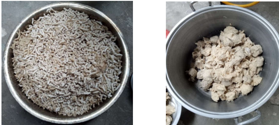
Gambar 3. (a) bumbu yang sudah dihaluskan (b) Jamur tiram yang sudah direbus dan dihaluskan