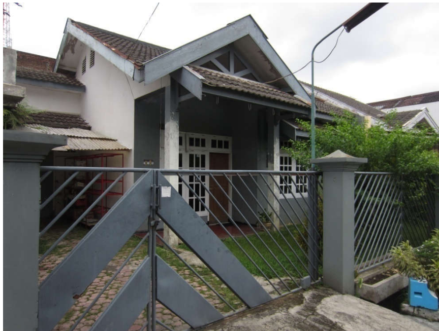
Gambar 2. Bangunan Lokasi Penelitian