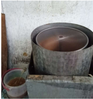
Gambar 6. (a) Pengeluaran minyak dengan menggunakan spinner 2