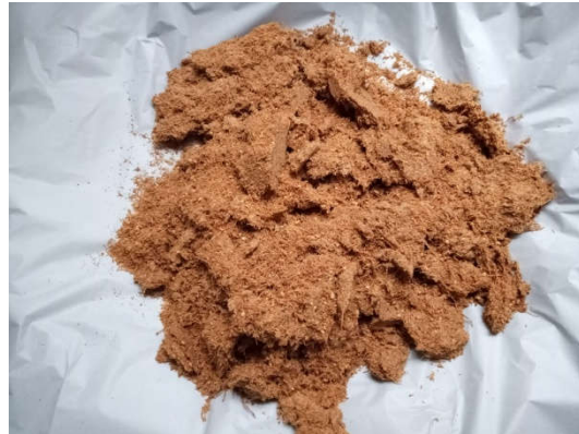
(b) Penirisan abon jamur