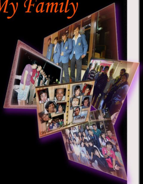
Konco Kampus ←