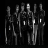
Crew Celebica Organizer ←