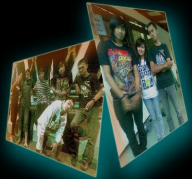
→ Konco dulen