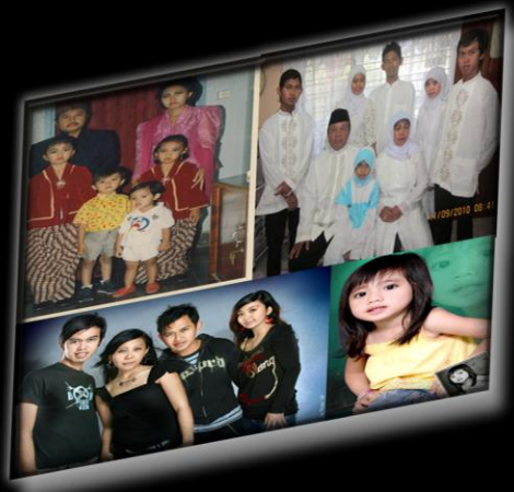
→ My Family