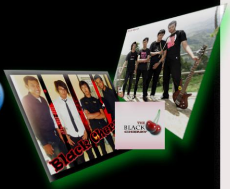
Band Q ←