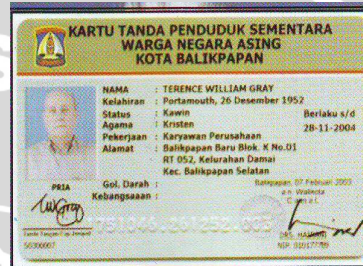
KTP Sementara WNA