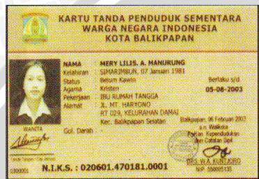
KTP Sementara WNI