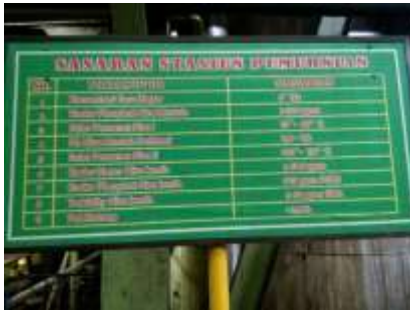
Gambar 4. Sasaran Stasiun Pemurnian