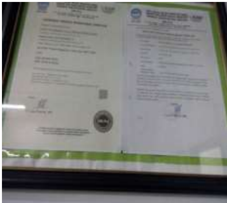
Gambar 6. Sertifikat SNI 3140.3:2010