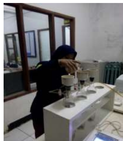
Gambar 9. Penggunaan pompa vakum