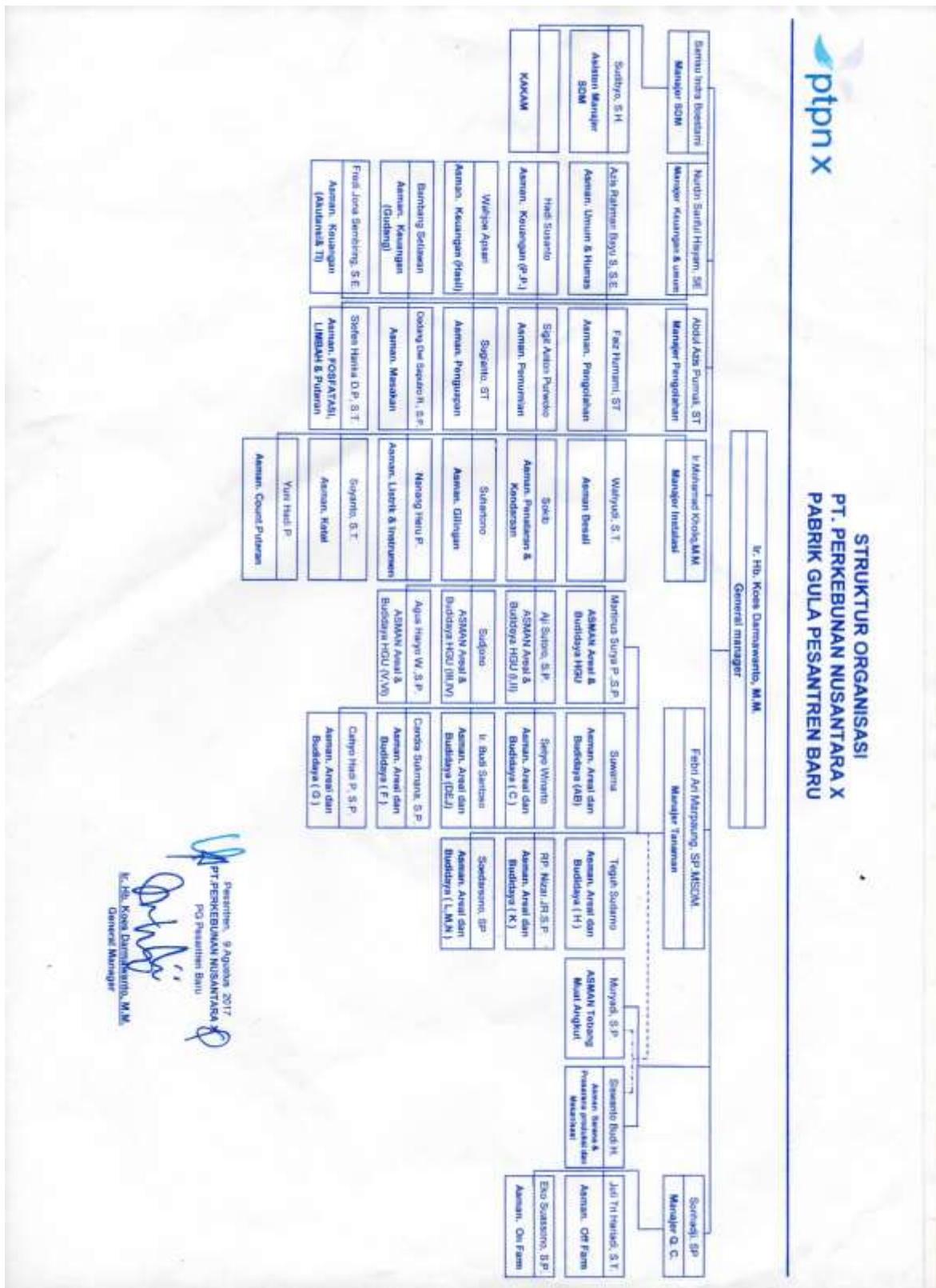
Lampiran 2. Bagan Struktur Organisasi PTPN X PG Pesantren Baru