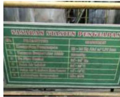
Gambar 5. Sasaran Stasiun Penguapan