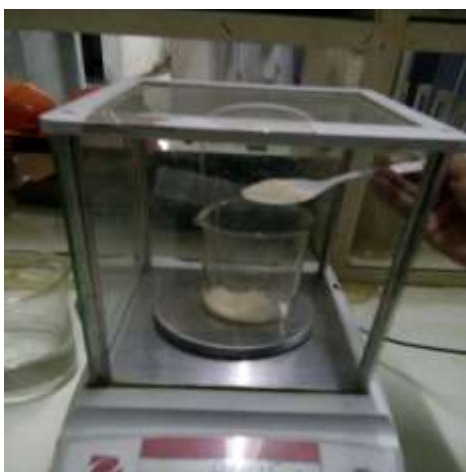
Gambar 8. Timbangan analitik