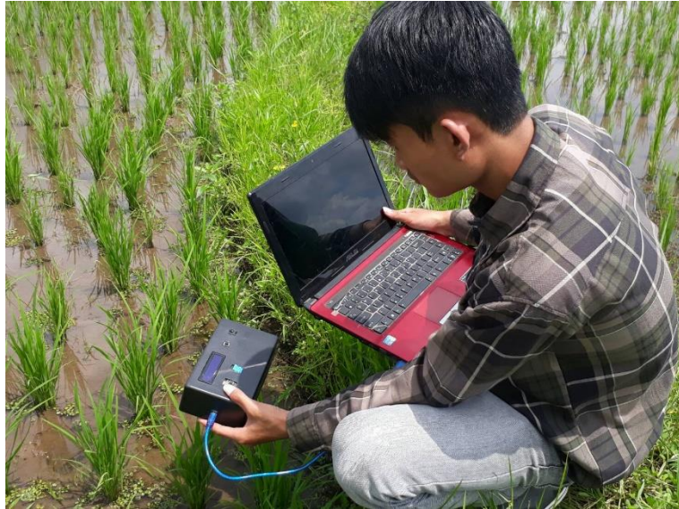
Gambar 0.5 Dokumentasi pengujian serangan hama