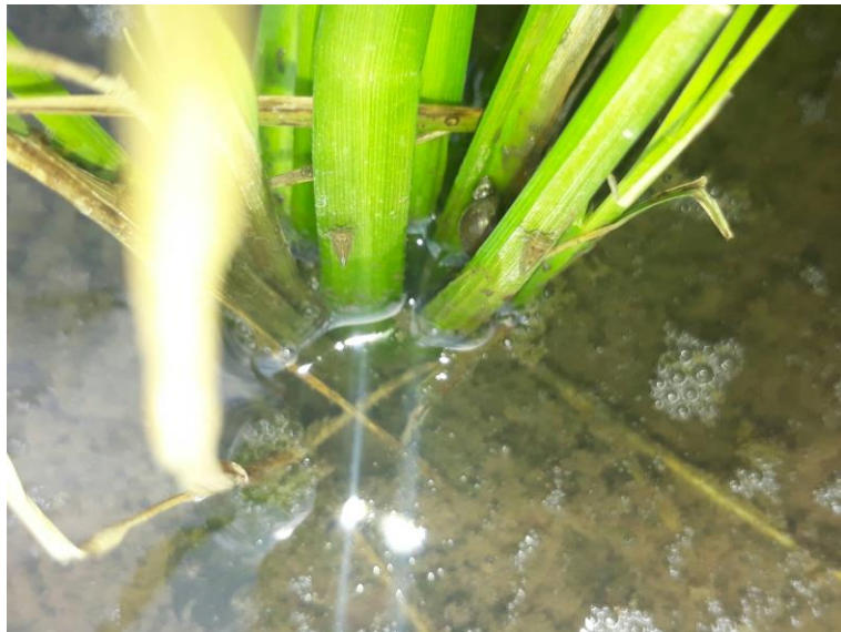
Gambar 0.6 Hasil "Ada wereng" saat pengujian serangan hama