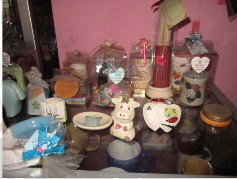
Contoh Souvenir XX Ceramics