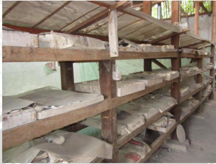
Rak Penyimpanan Keramik