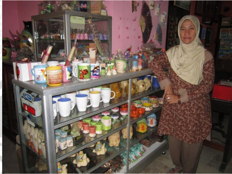
Etalase Toko dan Pemilik XX Ceramics