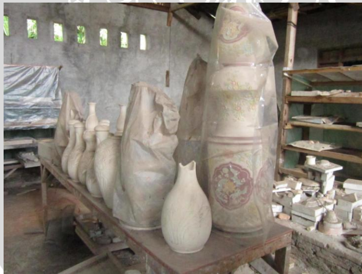
Keramik kering yang disimpan