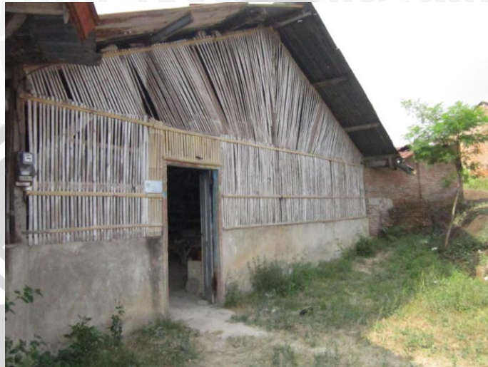
Tempat Produksi XX Ceramics