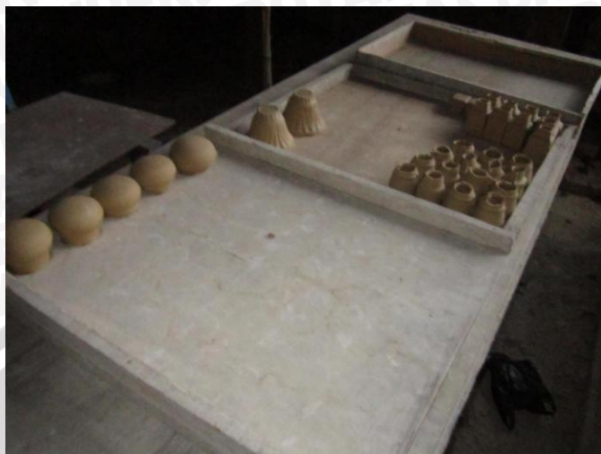
Hasil Cetakan Keramik