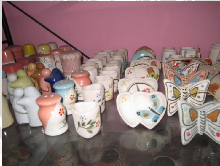
Produk Keramik XX Ceramics