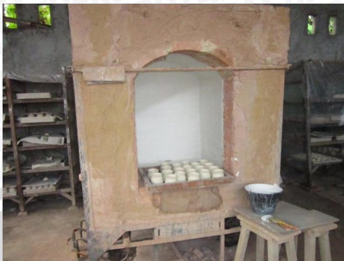
Mesin Oven Pembakaran Keramik