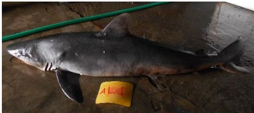
Gambar 6. Foto Hiu (Doc. Penelitian)