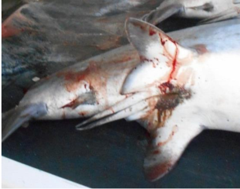
Gambar 8. Klasper pada Hiu Jantan (Doc. Penelitian)