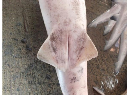
Gambar 9. Betina tidak ada Klasper (Doc. Penelitian)